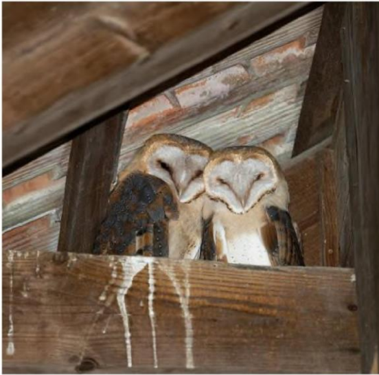
Warten ab 19.00 Uhr bis die erste Beute kommt