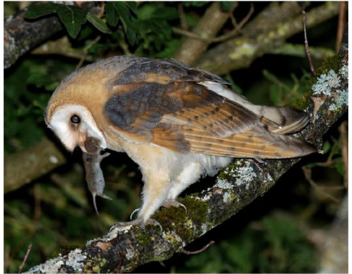
Jungeule (9-10 Wo) mit Maus auf die sie in der Dunkelheit mit „schnarchendem Ruf“ wartet (1-2 Std.)

Am 25. Juli 22 berichtete „Die Botschaft“ auf der Titelseite über die brütenden Schleiereulen im „Bärihuus“ an der Kruggasse. Zu sehen waren bei einer einmaligen Bestandsaufnahme im Brutkasten, vier junge Schleiereulchen mit weissem Flaumfedernkleid. Unterdessen ist viel passiert und die Schleiereulen haben sich gut entwickelt. Die neusten Fotos bestätigen das. Der Fotograf (Luzius Schneider), muss jeweils viel Geduld aufbringen (3 bis 4 Stunden) um die nachtaktiven Eulen knipsen zu können.