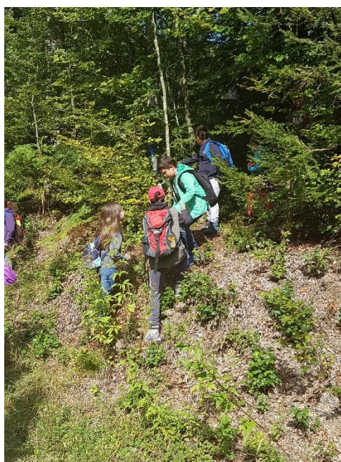
Jährlich findet ein Waldtag mit der gesamten Schule Siglistorf statt.

2019 hat der Forstbetrieb mit verschiedenen Medien über das aktuelle Forstgeschehen informiert. Die Website wurde ausgebaut. Zusätzlich wurde am einheitlichen Auftritt nach Aussen gearbeitet. Im März haben wir am «Grill-Pool-Challenge 2019» teilgenommen und dazu einen Film produziert. Am 26.3.19 hat der traditionelle Waldtag mit der Schule zum Thema «Eicheln stufen» stattgefunden.