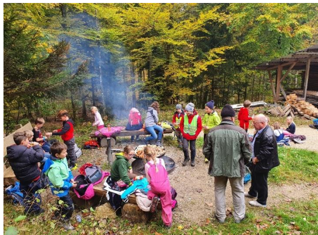
Waldtag mit der Gesamtschule Siglistorf zum Thema «Forstmaschinen».

2021 hat der Forstbetrieb über verschiedenen Medien über das aktuelle Forstgeschehen informiert. In Ehrendingen, Schneisingen, Siglistorf und Bad Zurzach haben Anlässe mit den Schulen stattgefunden. In Bad Zurzach, Mellikon, Siglistorf und Ehrendingen wurden gut besuchte Waldumgänge mit der Bevölkerung durchgeführt.