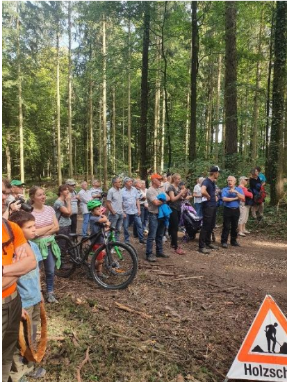
Waldumgang mit der Ehrendinger Bevölkerung zum Thema «Vollmechanisierte Holzerei» im Hasel.