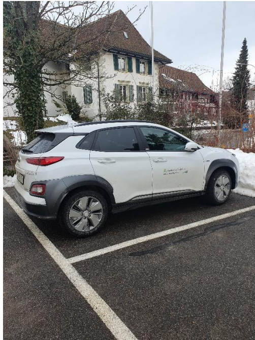
Im Dezember wurde ein voll elektrisches Dienstfahrzeug für den Förster angeschafft.

In Siglistorf wurde nur zurückhaltend Frischholz geerntet, weil zuerst alles Sturm- und Käferholz aus dem Wald abgeführt werden musste. Darum wurden einige geplante Holzschläge zurückgestellt.