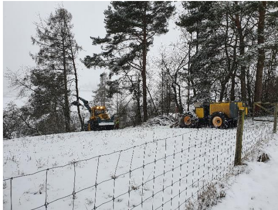
Gartenholzerei unter erschwerten Bedingungen - eine Lieblingsdisziplin unseres Forstteams.

Der Forstbetrieb durfte im Jahr 2020 für CHF 621'832 Aufträge für Firmen, Private, die Gemeinden und den Kanton ausführen. Damit wurde das Jahresziel übertroffen.